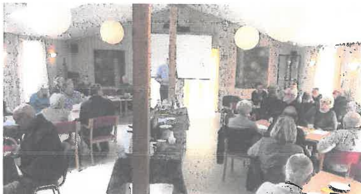
Ekstraordinær generalforsamling i Rødvig Feriebys lokaler. Der var fremmødt mange medlemmer - dækkende 30 parceller - til generalforsamlingen.